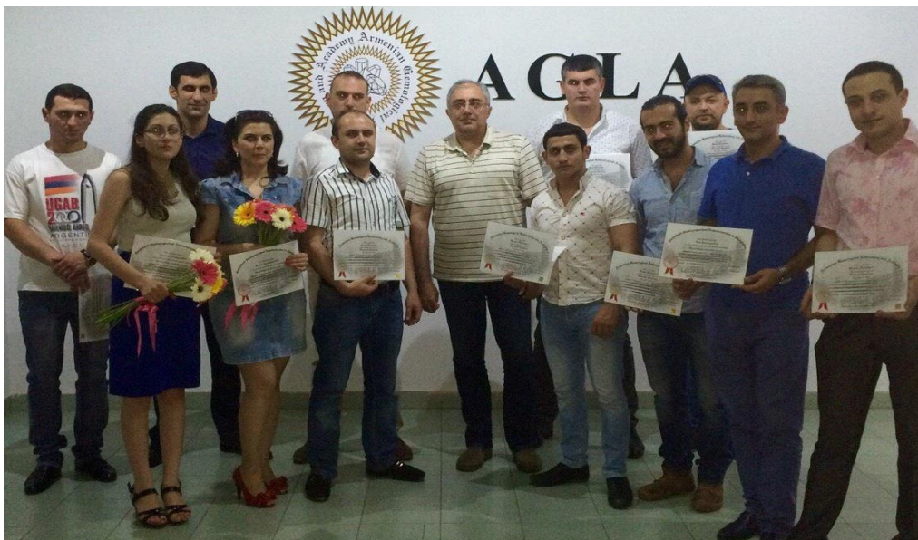
Graduation ceremony at AGLA in Armenia (2015)