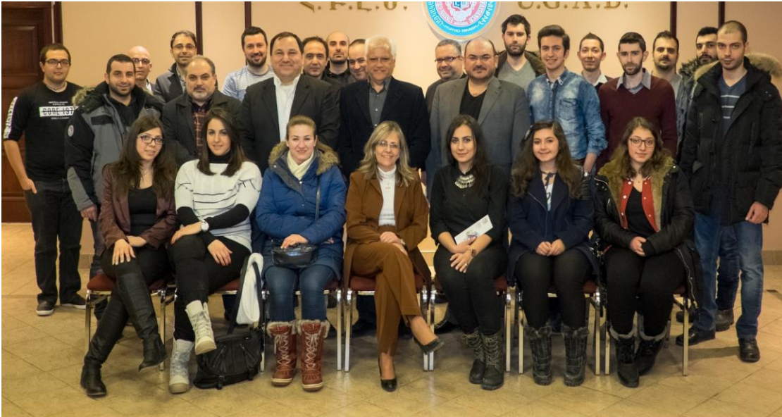
Syrian Armenians in Canada selected to begin courses at EGM during an event on January 22