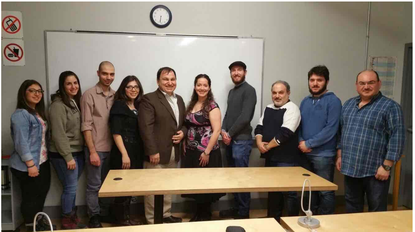
The graduate class of AJF students after receiving their certificates on January 27, 2016