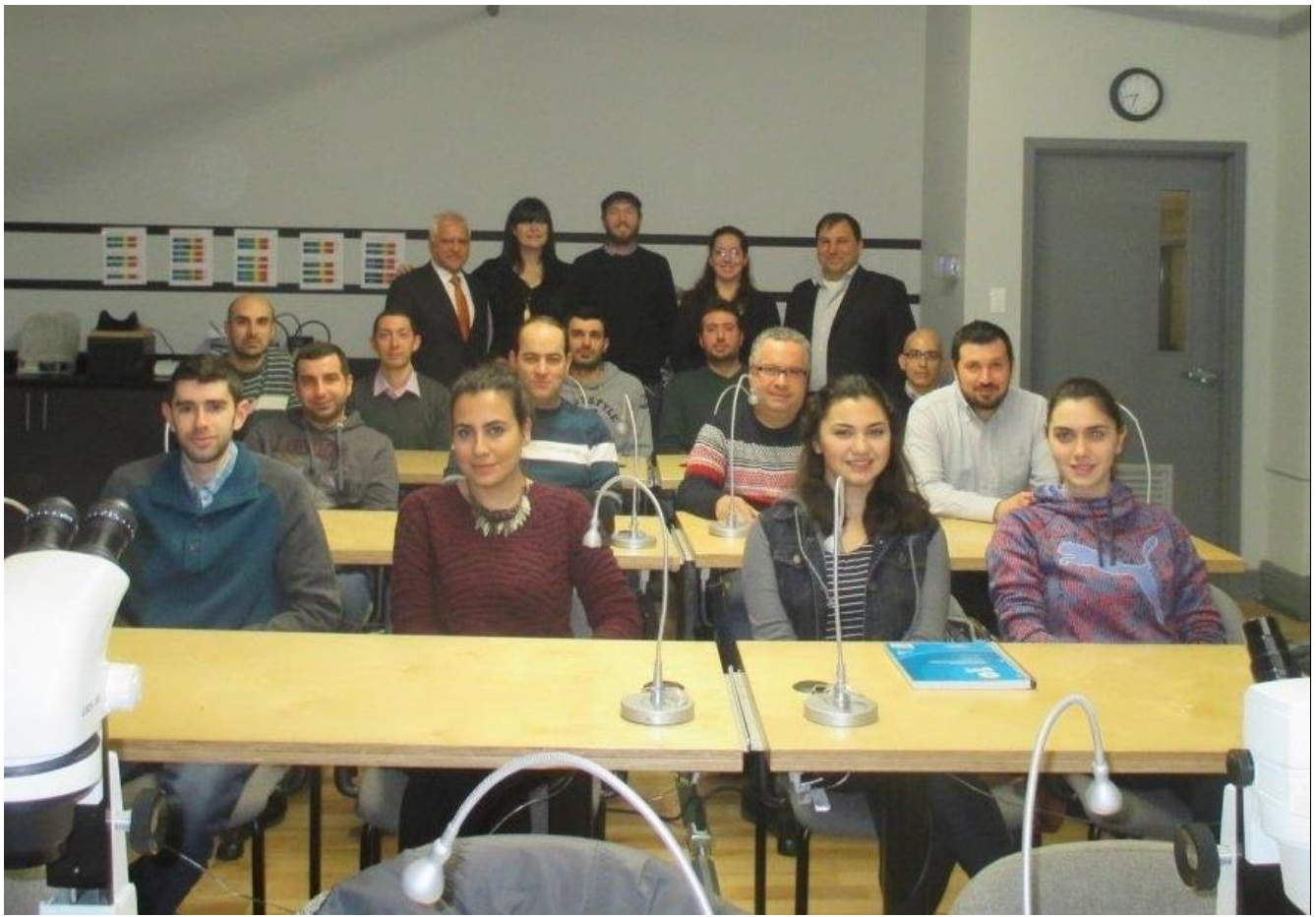
The new class of Gemology 1 with 13 students on January 28, 2016